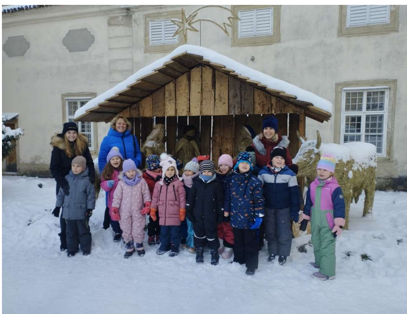
Paní učitelky ze Žluté třídy