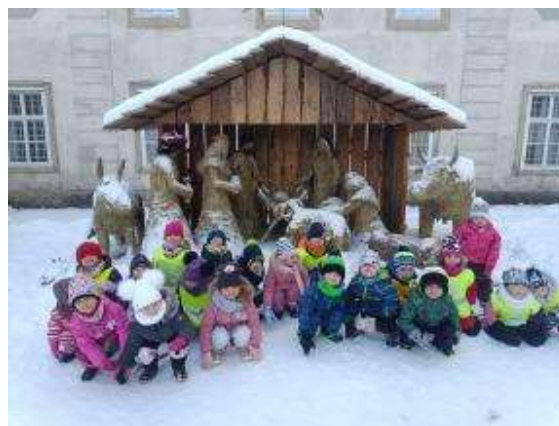
Ahoj děti a paní učitelky ze Zelené třídy

Letos se nám také moc povedla besídka, která nebyla tradičně Vánoční, ale Martinská. Začátek byl v dalekém Grónsku. Už teď se těšíme, jaké další představení si pro své rodiče připravíme. Při návštěvě Mikuláše jsme všechny děti dostaly balíčky a později pod stromečkem spoustu nových hraček. Paní učitelky nás hodně fotí, můžete se podívat na stránky školky, uvidíte, co všechno krásného děláme, podnikáme, vyrábíme a prostě jaké je to tu prima.